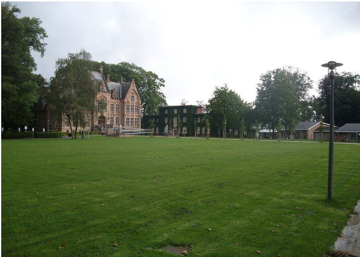
KASTEEL MARIASTEEN, DOMINIEK SAVIO INSTITUUT GITS

Het Dominiek Savio Instituut, waar de startzaal van deze wandeltocht is gevestigd, is een begrip in de zorgsector. Het instituut bestaat reeds sedert 1958 en werd gevestigd op het domein dat indertijd door de Witte Paters van Afrika werd bewoond.