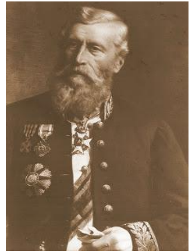
Senator Leo Van Ockerhout

De eerste abt was uiteraard Gerard van Caloen. Reeds in 1911 werd de abdijschool opgericht die vandaag enkel internen telt. Ze zijn met een 300-tal jongens en meisjes.